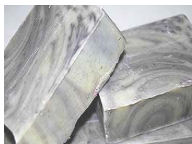
Pachthouli & Gengibre Extracto de gengibre e óleo essencial de Pachthouli. Pode ser utilizado com Shampoo (+/-100gr) 4,15€