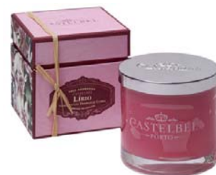
Velas Aromáticas Alfazema Limão & Salva Lírio Magnólia Figo & Pera 16,95€