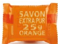
Sabonete Marseille 25gr 1,00€ Vervena - Lima/Limão Laranja Alfazema

Embalagem pequena para levar de fim-de-semana, ou para utilizar no ginásio