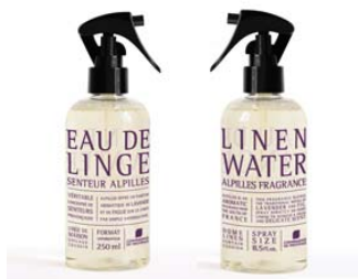
Água Floral Alpillles - Alfazema Embalagem 250ml c/difusor Pode ser reutilizado, comas recargas de 750ml 7,65€