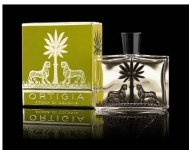
Água de Colónia, 100ml Lima da Sicilia 68,99€