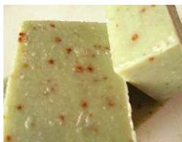
Abacate Com óleo essencial e puré de pêra abacate. (+/-100gr) 4,15€