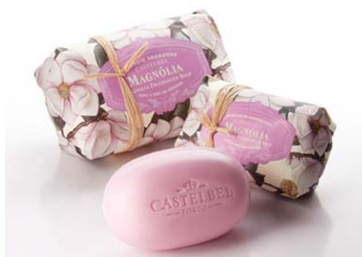
Sabonetes Alfazema Limão & Salva Lírio Magnólia Figo & Pera Rosa Madresilva 4,95€