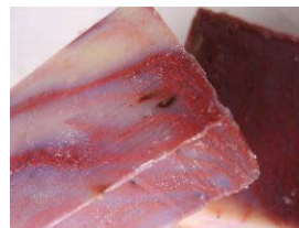
Terapia do Vinho Sumo de uvas frescas, vinho e óleo essencial de grainha de uva (+/-100gr) 4,15€