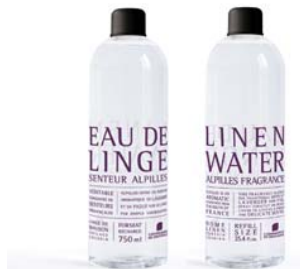
Recargas Água Floral 750ml Alpillles - Alfazema 11,70€