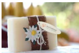
Coconut (100gr) KT0020 3,00€