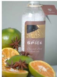
Oriental Spicy Bath Salt Sais de Banho 500gr KT0011 6,99€