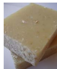
Oat & Lemon Butter

Óleos essenciais de alfazema e lavandin. Decorado com botões de alfazema azul.