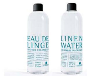
Recargas Água Floral 750ml Calanques - Brisa Marinha 11,70€