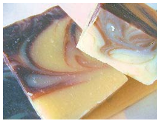
Chocolate & Praliné C/ óleo de amêndoas doces e manteiga de cacau orgânica (+/-100gr) 4,15€