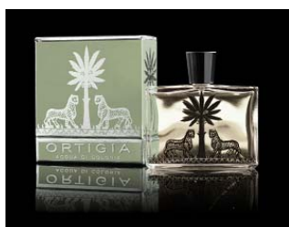
Água de Colónia, 100ml Figo da India 68,99€