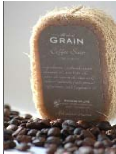
Purifier coffe exfoliating soap KT0003 3,00€

Os grãos de Café e de Arroz são perfeitos para desintoxicar e esfoliar suavemente a sua pele