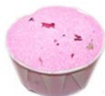
Relaxing Rose Aroma floral para relaxar AW0096 2,55€

Bombas com manteiga de karité, extra borbulhas, extra espuma e extra fragrância, proporcionam um banho surpreendente