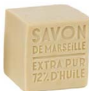
Sabonete Tradicional de Marseille de Palma 400gr 3,65€