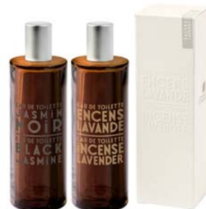
Perfume 100ml Alfazema Jasmin & notas de pimenta preta 34,75€