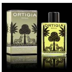
Óleo de banho Figo da India 37,95€