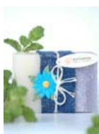
Lavender & Peppermint (100gr) KT0055 3,00€