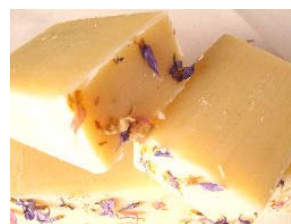
Orquídea & Jasmim Aromas doces e afrodisíacos das essências exóticas de jasmim e orquídea (+/-100gr) 4,15€