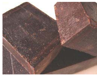
Baunilha Baunilha c/manteiga de cacau e óleos essenciais Patchouli e Alfazema (+/-100gr) 4,15€