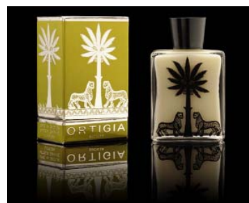
After-shave Lima da Sicilia 43,60€