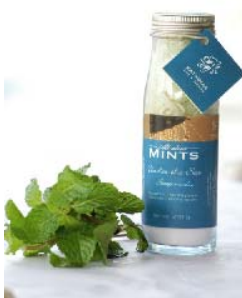
Under the sea scrub KT0014 Exfoliante