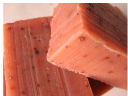
Iogurte e Morango Puré de morango fresco, extracto de morango e iogurte grego (+/-100gr) 4,15€