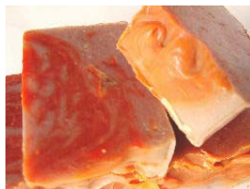
Laranja, Chocolate & Canela Sumo de laranjas frescas, um toque de canela e inclusão de cacau em pó puro (+/-100gr) 4,15€