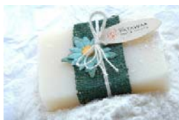
Jasmine Rice (100gr) KT0018 3,00€

Chabalang - Sabonete natural produzido por processos artesanias com aromas a frutos, flores e plantas.