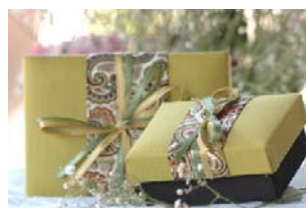
Green Japanese Silk KT0050 Cx Seda para 2 Sabonetes