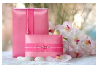
Pink Silk KT0060 Cx Seda para 1 Sabonete