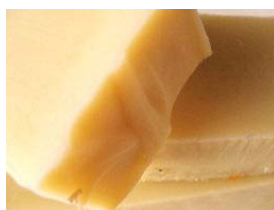
Tahiti Monoi do Tahiti, óleo de coco puro e óleo essencial de jasmim (+/-100gr) 4,15€