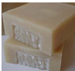
Goat's Milk & Honey (+/-100gr) 3,70€ Leite fresco de cabra, mel e cera de abelhas, óleo de palma, óleo de coco, manteiga de cacau. Adequado para Pele normais e seca

Naturais, puros, suaves e sem perfume, adequados para quem tem a pele mais sensível e para quem prefere os sabonetes com aromas neutros.