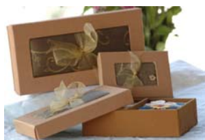
Gold Silk KT0061 Cx Seda para 1 Sabonete KT0062 Cx Seda para 2 Sabonetes