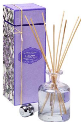
Ambientador p/Casa Alfazema Figo & Pera Limão & Salva Rosa 26,50€