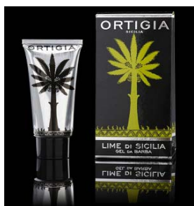
Shaving gel Lima da Sicilia 15,00€

Inspirados na riqueza da cultura e na beleza natural da Sicília, todos os produtos são feitos a partir de ingredientes tradicionais e naturais como azeite, óleo de palma, óleo de amêndoas, lanolina, lavanda natural destilada e corantes vegetais.