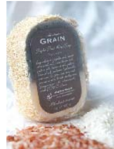
Sweet Combined Rice Exfoliating KT0002 3,00€