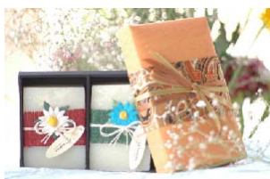
Orange Japanese Silk KT0059 Cx Seda p/1 Sabonete KT0051 Cx Seda p/ 2 Sabonetes

Cx Seda + 1 Sabonete 6,50€ Cx Seda + 2 Sabonetes 10,55€