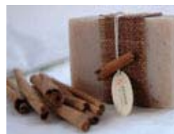
Cinnamon Spice (100gr) KT0054 3,00€