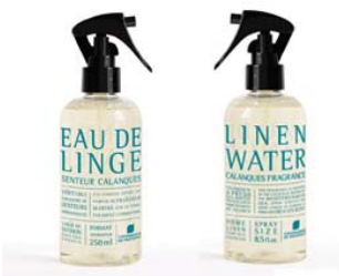
Água Floral Calanques - Brisa Marinha Embalagem 250ml c/difusor Pode ser reutilizado, comas recargas de 750ml 7,65€