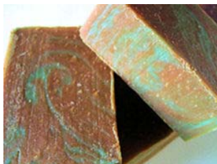
Chocolate & Menta Com manteiga de cacau orgânica e óleo essencial de menta (+/-100gr) 4,15€