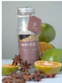
Oriental Spicy scrub KT0015 Exfoliante

Under de Sea e Oriental Spicy Scrub, são sabonetes granulados enriquecida com Vitamina E e sal marinho para uma exfoliação suave da pele