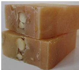
Oatmilk, almond and lemongrass (+/-100gr) 4,15€ Com infusão de leite da aveia orgânica, amêndoas moídas e óleos essenciais de lemongrass e de ylang do ylang