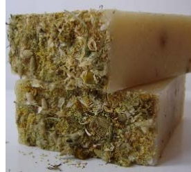
Chamomile & Lavender (+/-100gr) 4,15€ Decocção de flores de camomila e óleos essenciais puros de alfazema e lavandin