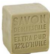
Sabonete Tradicional de Marseille de Azeite 400gr 3,65€