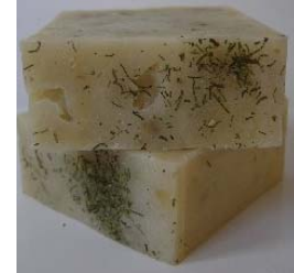
Cucumber, Aloe & Lime (+/-100gr) 4,15€ Sumo de aloe vera, puré de pepino e óleos essenciais de lima, cedro e lavandin