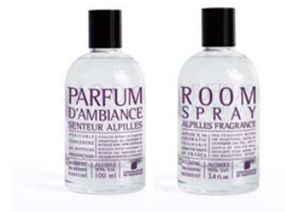
Perfume para a Casa Alfazema 15,80€