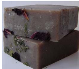
Rosehip, Orange and patchouli (+/-100gr) 4,15€ Com rosehips e amêndoa finamente moídas, e óleos essenciais de laranja e de patchouli