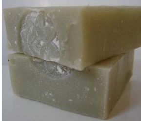
Green Clay, Geranium & Lavender (+/-100gr) 4,15€ Argila verde e óleos essenciais de gerânio, alfazema e lavandim

Sabonetes feitos à mão usando apenas os melhores ingredientes naturais para nutrir a sua pele. Todos os sabonetes Earthly Delights tem como base, óleo de palma, óleo de azeitona, óleo de girassol, óleo de rícino, manteiga de cacau e manteiga de shea.