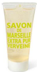
Gel Duche 30ml 2,50€ Vervena - Lima/Limão Laranja