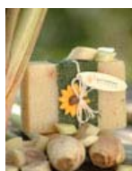
Lemongrass (100gr) KT0056 3,00€